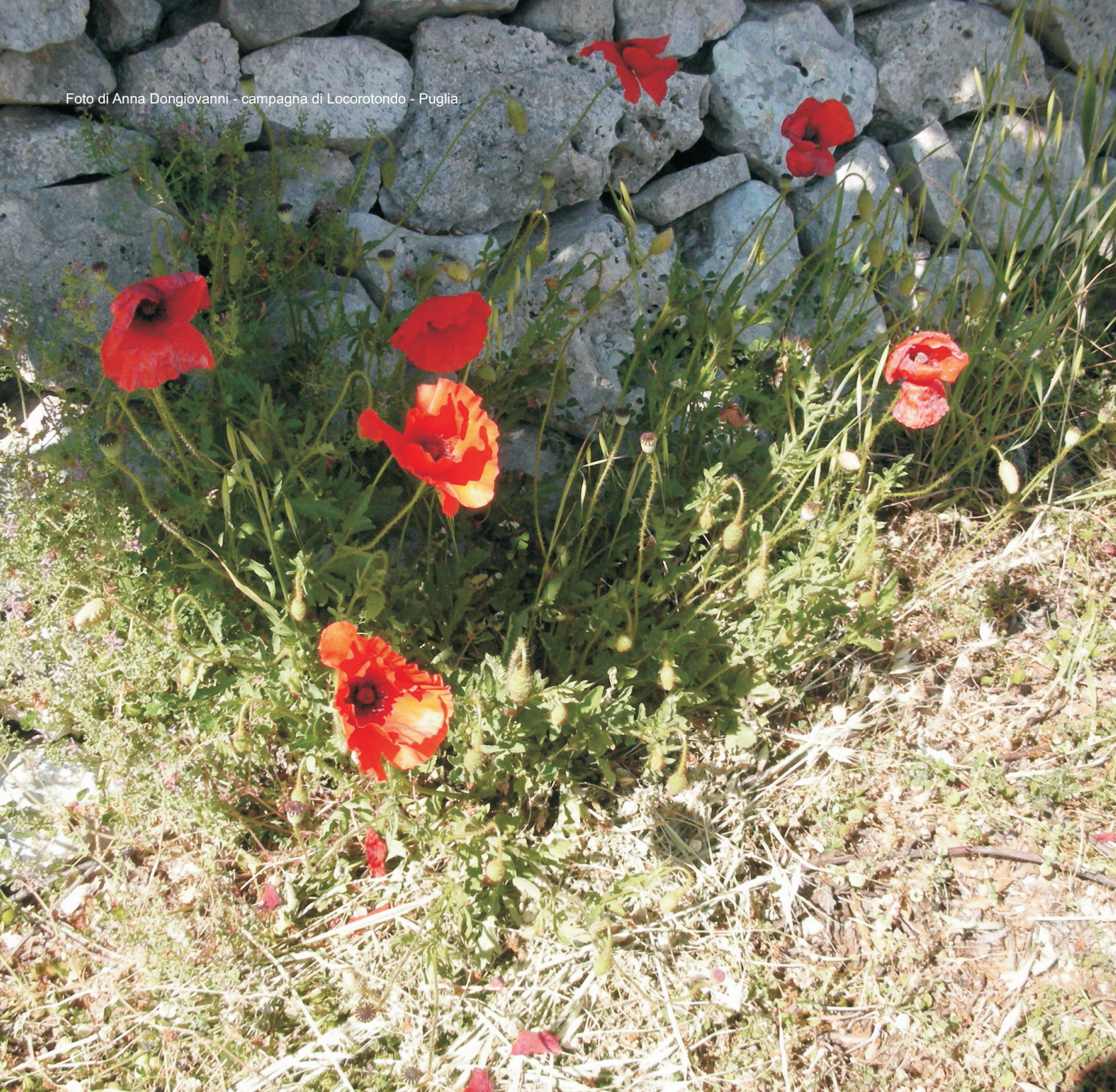
campagna di Locorotondo - Puglia

“Greta è portatrice di un messaggio di una semplicità rivoluzionaria: ‘Listen to science’, non ascoltate me, ascoltate la scienza”.