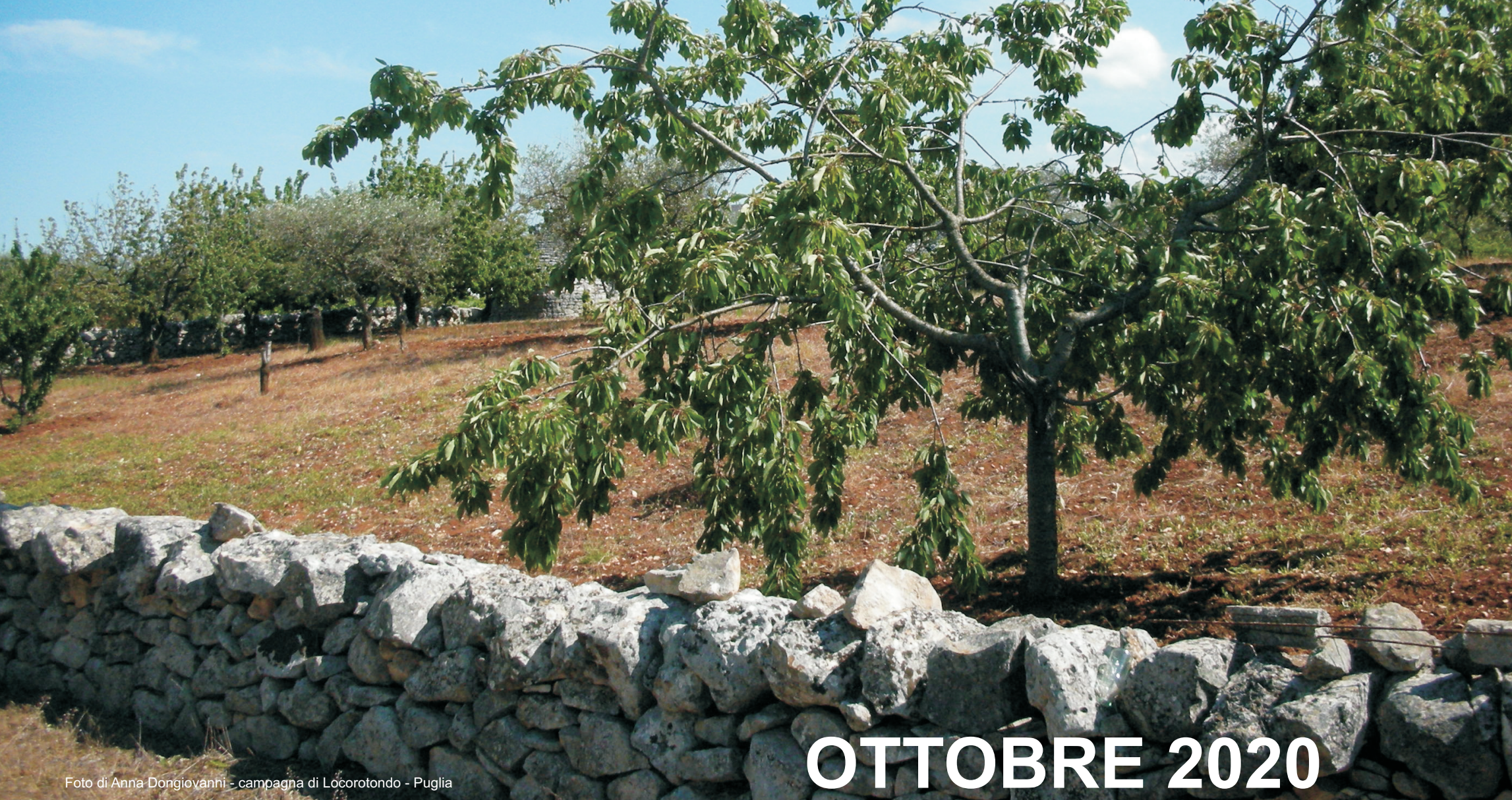
campagna di Locorotondo - Puglia